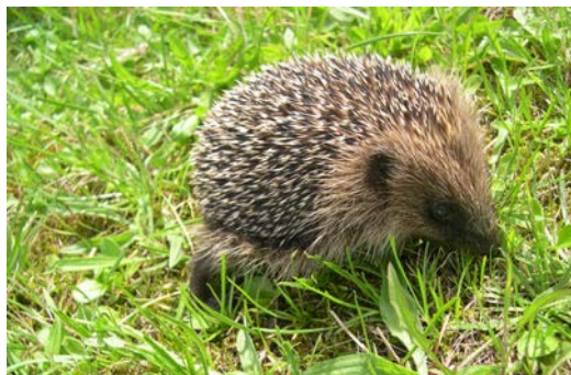
Hérisson d'Europe

Parasites : puces du hérisson, tiques, vers (intestinaux, pulmonaires).