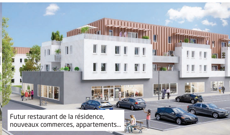
Futur restaurant de la résidence, nouveaux commerces, appartements...