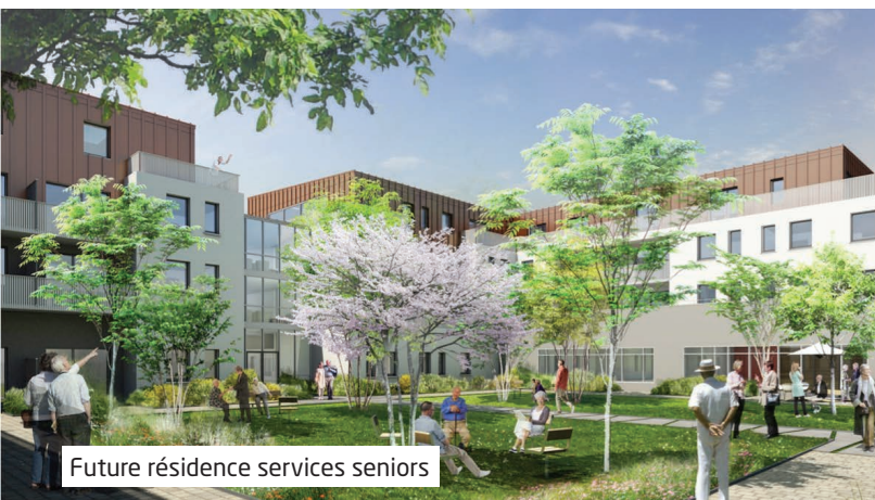
Future résidence services seniors