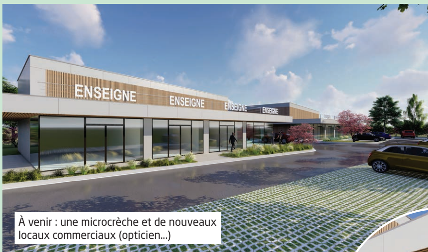
À venir : une microcrèche et de nouveaux locaux commerciaux (opticien...)