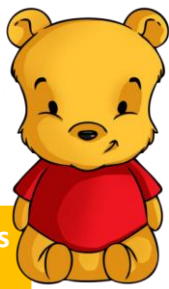
Oursons 3 ans