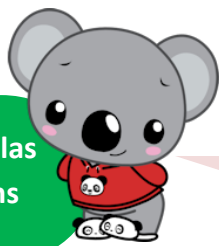
Koalas 5 ans